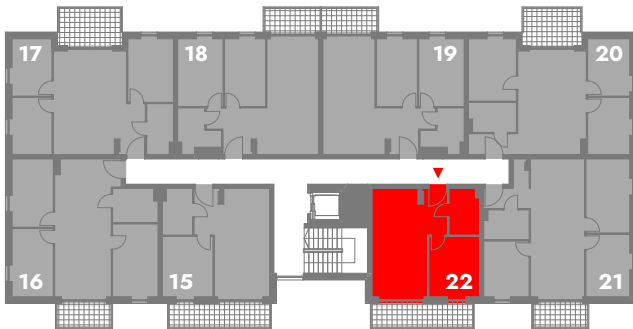
SCHEMATYCZNY RZUT 2 PIĘTRA