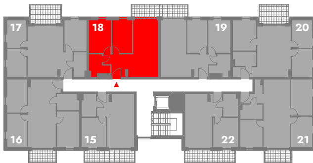
SCHEMATYCZNY RZUT 2 PIĘTRA