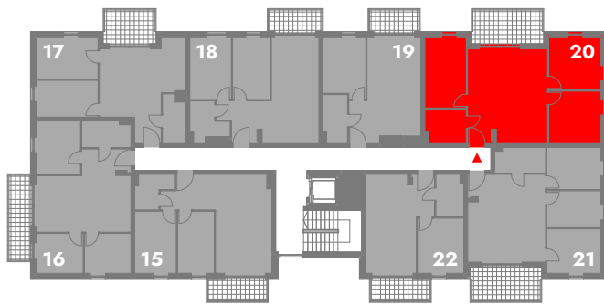
SCHEMATYCZNY RZUT 2 PIĘTRA