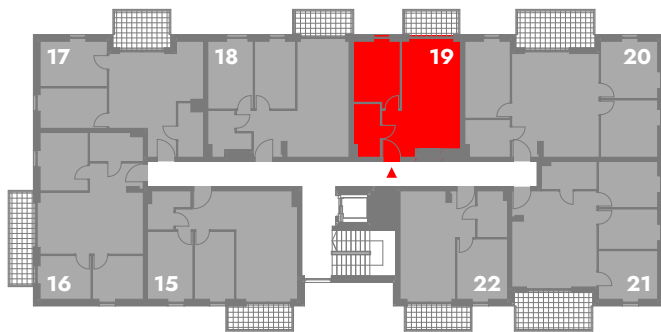
SCHEMATYCZNY RZUT 2 PIĘTRA