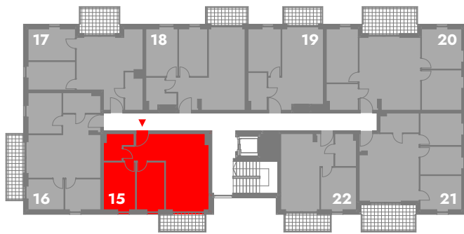
SCHEMATYCZNY RZUT 2 PIĘTRA