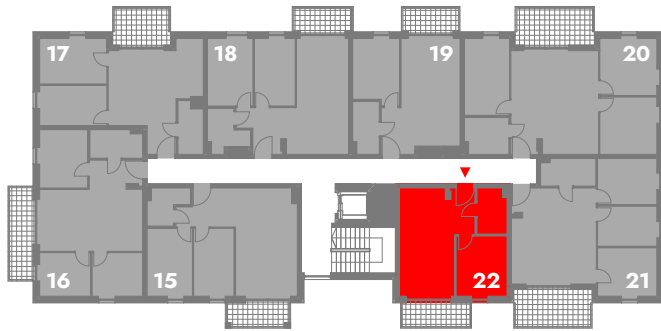
SCHEMATYCZNY RZUT 2 PIĘTRA