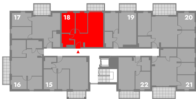
SCHEMATYCZNY RZUT 2 PIĘTRA