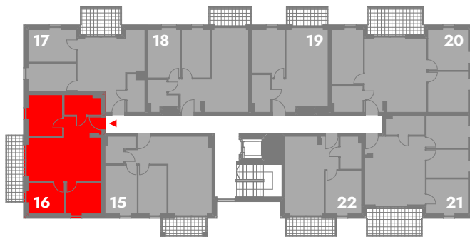
SCHEMATYCZNY RZUT 2 PIĘTRA