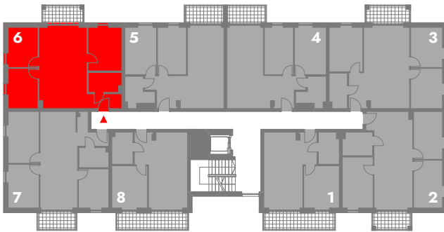
SCHEMATYCZNY RZUT 1 PIĘTRA