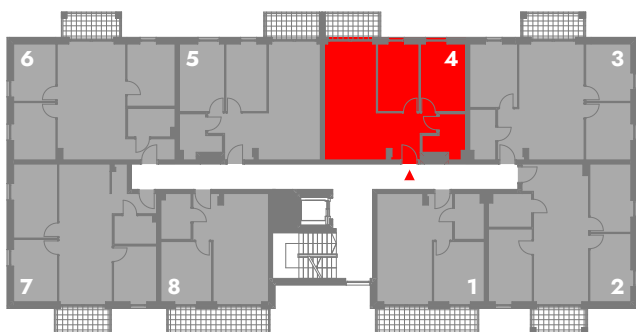
SCHEMATYCZNY RZUT 1 PIĘTRA