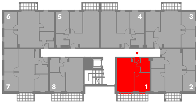
SCHEMATYCZNY RZUT 1 PIĘTRA